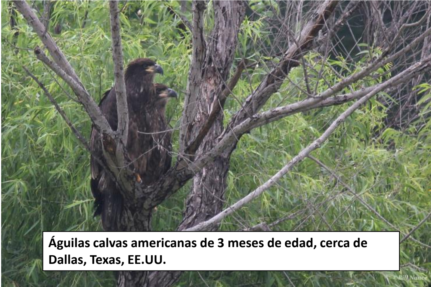
Águilas calvas americanas de 3 meses de edad, cerca de Dallas, Texas, EE.UU.

Utilizamos cámaras de vida silvestre de transmisión en vivo y herramientas de aprendizaje a distancia para atraer visitantes a nuestro centro de humedales